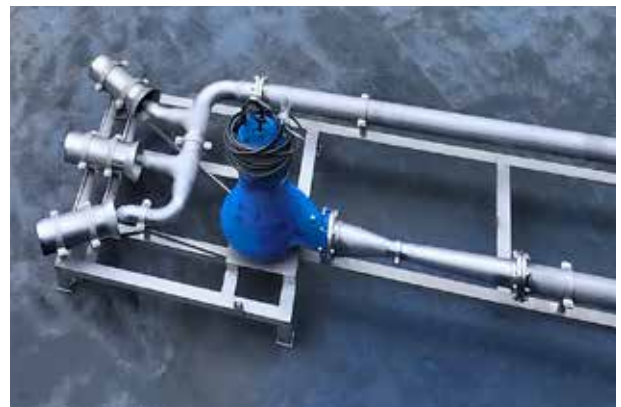
Messer BIOX-Jet Injektor zur effizienten Lösung von Sauerstoff in Wasser.

Bei Bedarf stellt Messer Ihnen auch eine vollständige mobile Anlage für den Eintrag von Reinsauerstoff zur Verfügung. So können Sie sich vollumfänglich von den Vorteilen einer Reinsauerstoffbegasung überzeugen oder diese, beispielsweise als Interimslösung für den Ersatz von defekten Belüftungssystemen, auch über einen längeren Zeitraum nutzen.