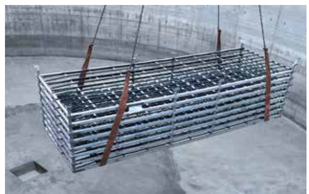
Messer Begasungsmatten – die einfache und effektive Lösung zum Sauerstoffeintrag.