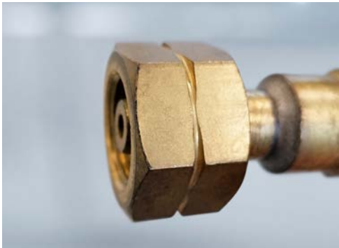
Anschlussmutter für Brenngase mit Nut