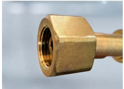
Anschlussmutter für andere Gase ohne Nut

Bei Brenngas-Flaschen weisen die unterschiedlichen Anschlüsse ein Linksgewinde auf. Bei allen anderen Gasflaschen besitzen die unterschiedlichen Anschlüsse ein Rechtsgewinde .